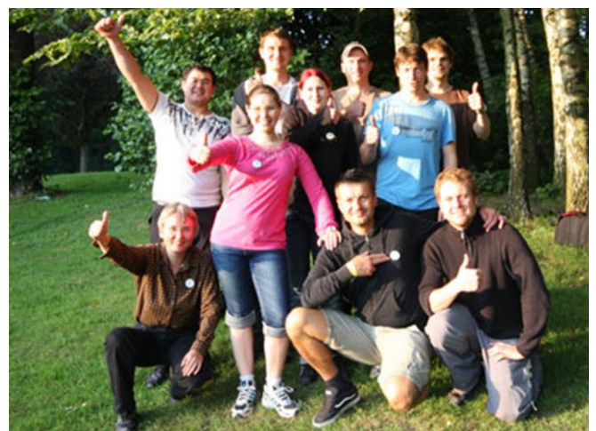
Teilnehmer von Go On! beim Auftakt.

Diese jungen Menschen (bis 30 Jahre) kommen bei den einzelnen körperlichen Aktivitäten ins Gespräch. Ob dies am Kletterturm des Alpenvereins, beim „Waldspaziergang“ im Hochseilgarten von Tree2Tree,